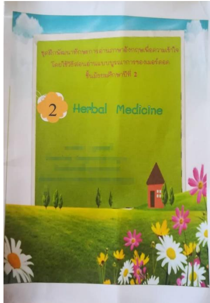
ภาพที่ 1 : ชุดฝึกพัฒนาทักษะการอ่านภาษาอังกฤษ