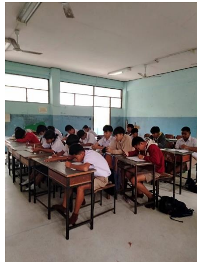
ภาพที่ 2 : การจัดกิจกรรมการเรียนรู้โดยใช้ชุดฝึกพัฒนาทักษะการอ่านภาษาอังกฤษ